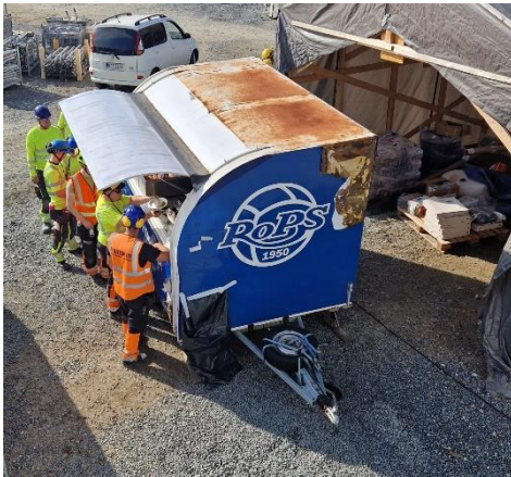
Ropsin hotdog vaunu